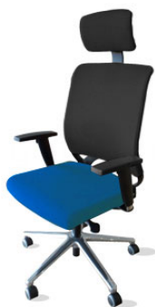
su galvos atlošu