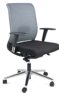
be galvos atlošo