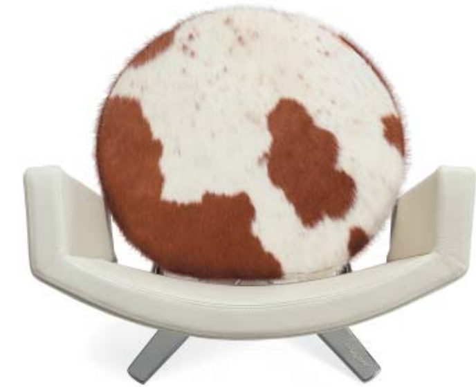
5610 CENTRUM fätölj / easy chair / sessel