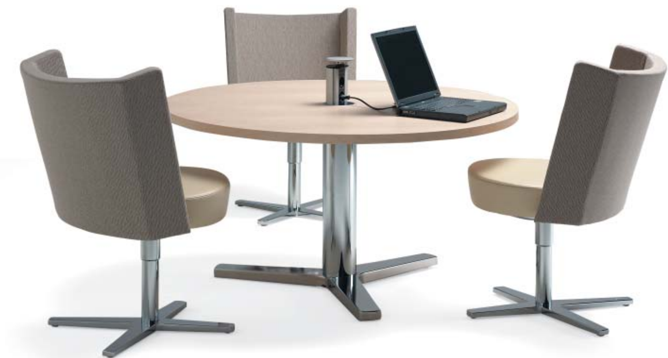
5610 CENTRUM fätölj / easy chair / sessel 1520 CENTRUM GRANDE konferensbord / conference table / konferenztisch 1571 POWERPORT kablagegenomföring / cable management / anschlussbox