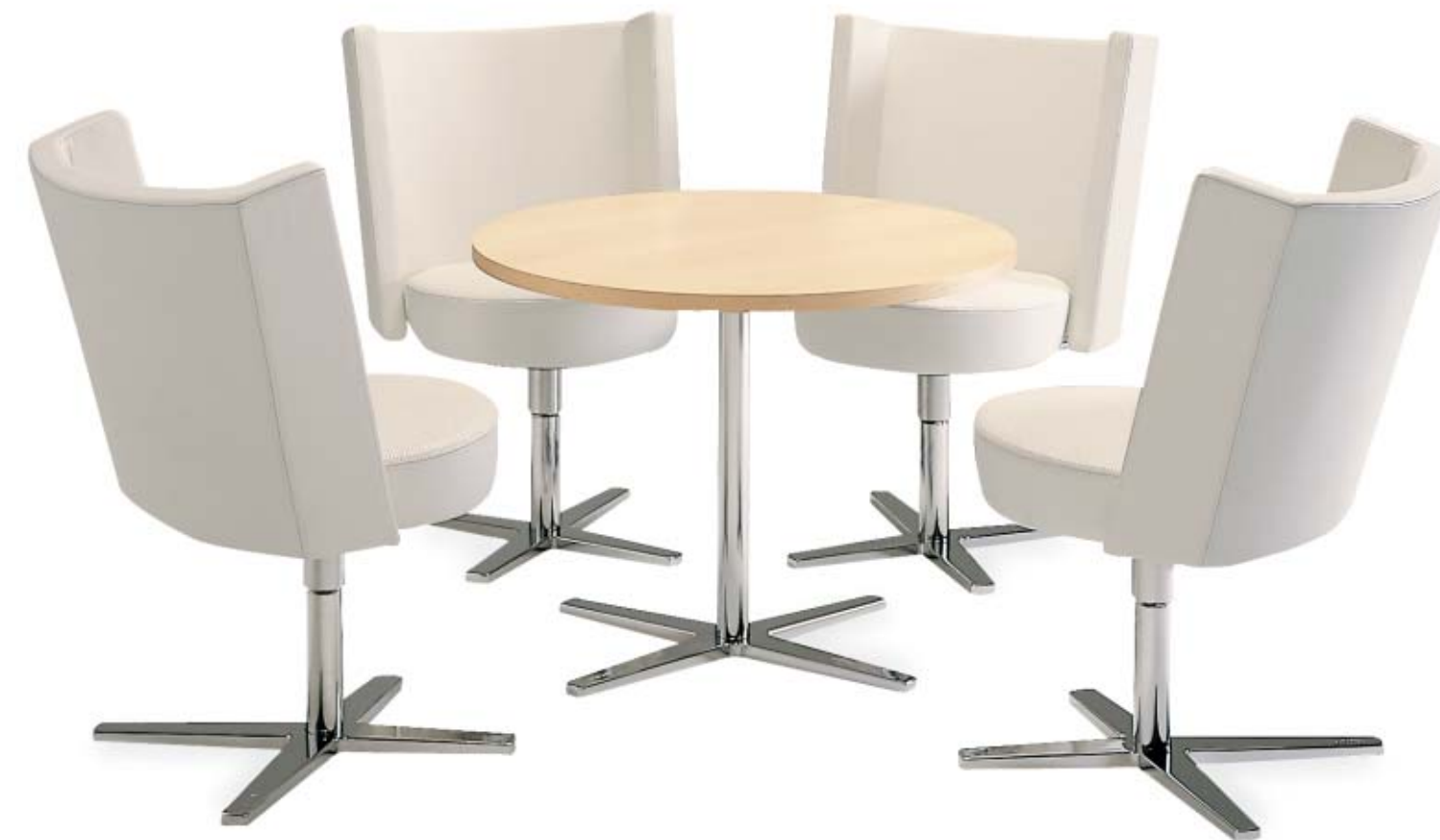
5610 CENTRUM fätölj / easy chair / sessel 1680 CENTRUM pelarbord / pedestal table / säulentisch