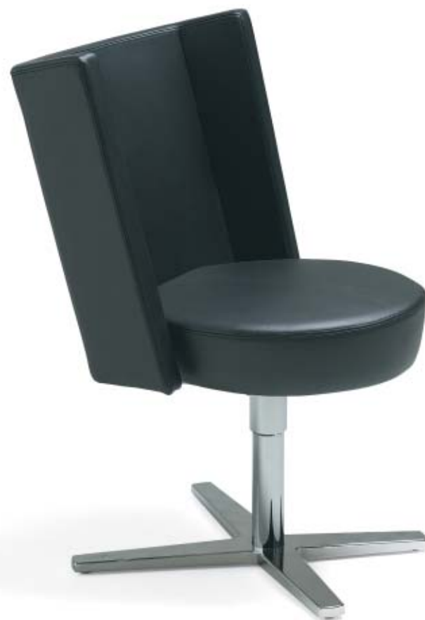
5610 CENTRUM fätölj / easy chair / sessel