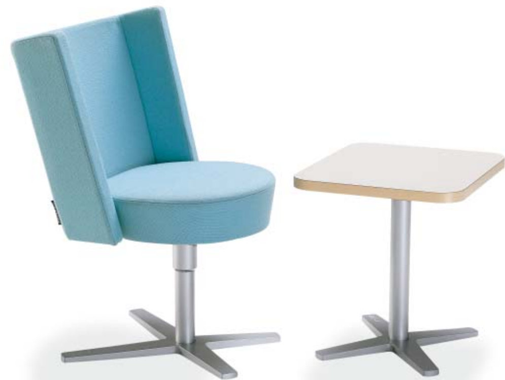
5610 CENTRUM fätölj / easy chair / sessel 1645 CENTRUM pelarbord / pedestal table / säulentisch