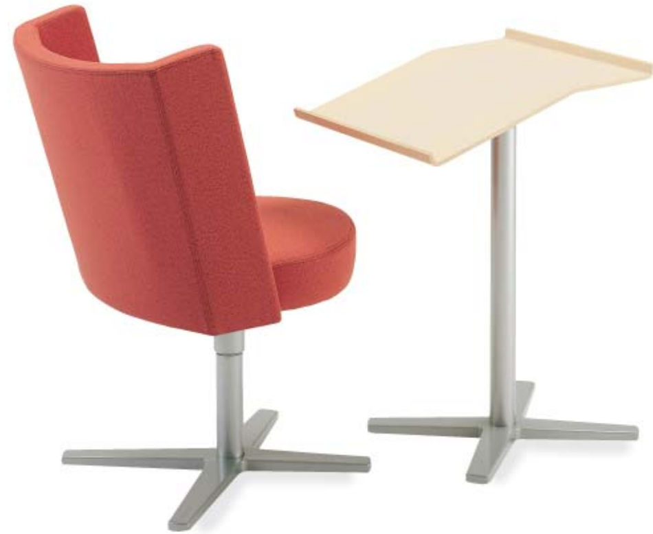
5610 CENTRUM fätölj / easy chair / sessel 1605 CENTRUM pulpet / desk / schreibpult