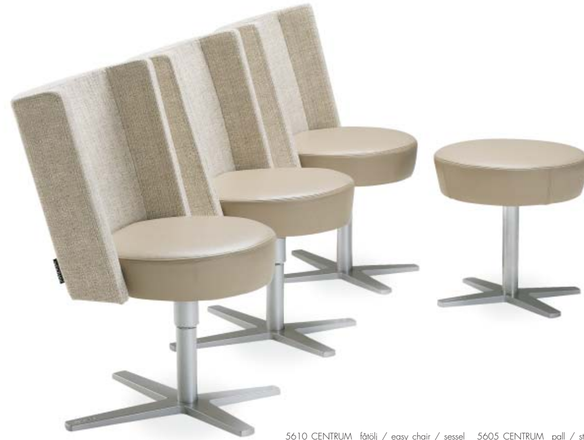
5610 CENTRUM fätölj / easy chair / sessel 5605 CENTRUM pall / stool / hocker